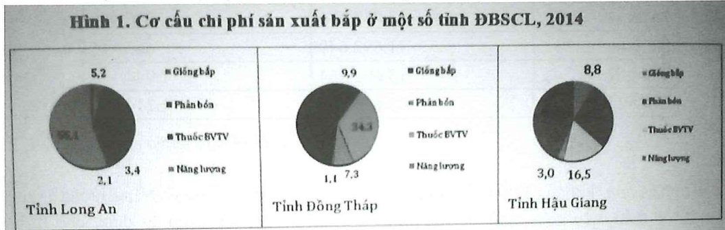
Nguồn: Hồ Cao Việt và cộng sự, 2014

Liên kết sản xuất-tiêu thụ bắp rất yếu (21% hộ ký kết hợp đồng với doanh nghiệp) do nông dân sản xuất manh mún (0,46-0,62 ha/hộ/vụ) và tự phát.