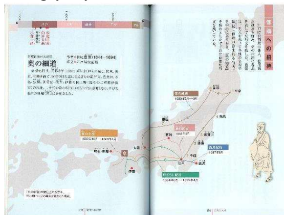
Hình 1: “Nẻo đường Đông Bắc” (Monbukagakusho, 2018: 174-175).

tất về tác giả, giá trị thi ca, còn kèm hình ảnh có màu về bản đồ chuyến lữ hành của nhà thơ Matsuo Basho (Hình 1) để học sinh dễ dàng nắm bắt hành trình cùng những địa danh mà nhà thơ đã đặt chân đến và để lại những áng thơ Haiku giá trị được lưu truyền đến ngày nay.